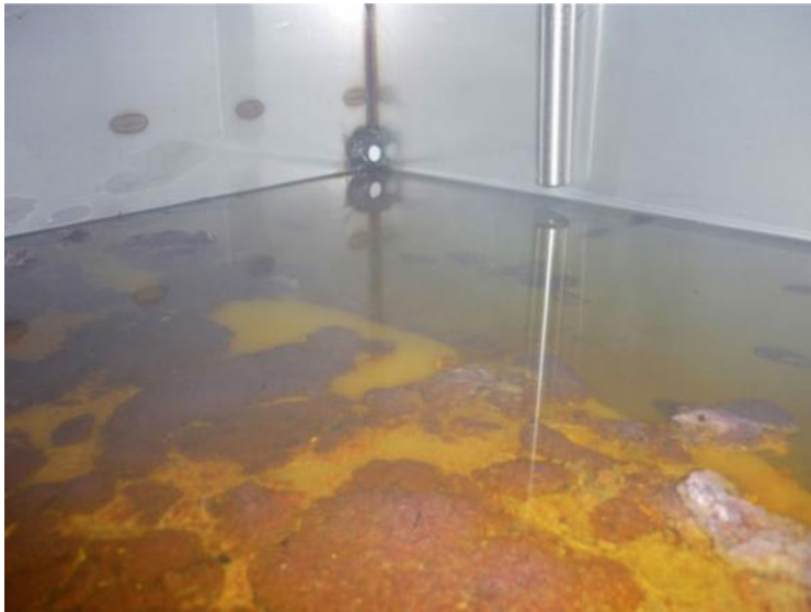
Zonder Ozon Ionisatie