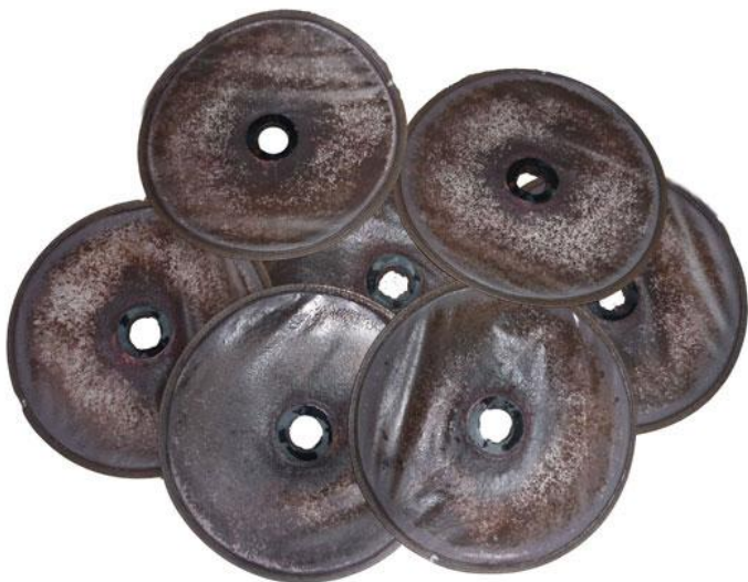
Zonder Ozon Ionisatie